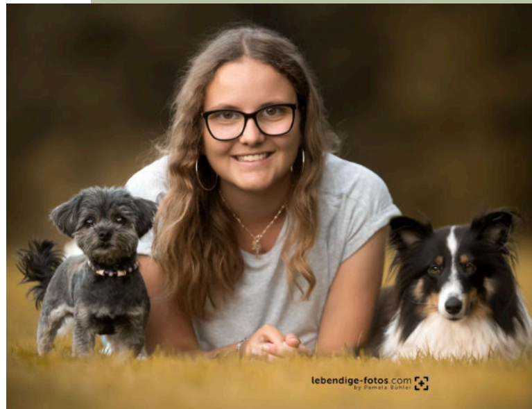
Ladinas eigenen Hunde «Missy» und «Hedda».