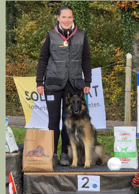
Erfolgreiches Jahr: Vize-Schweizermeister im Rule 2.